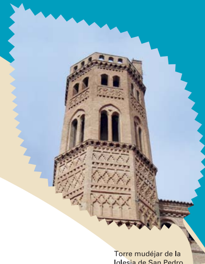
Torre mudéjar de la Iglesia de San Pedro