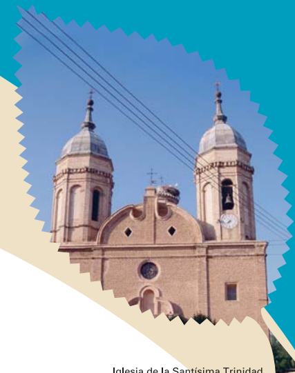
Iglesia de la Santísima Trinidad