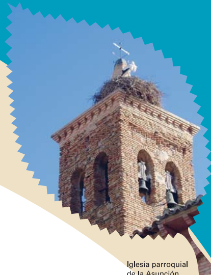
Iglesia parroquial de la Asunción