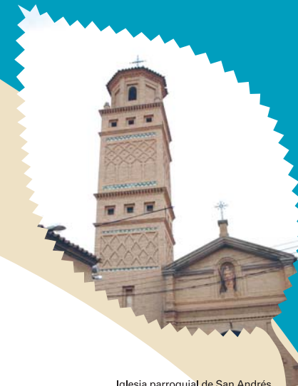
Iglesia parroquial de San Andrés