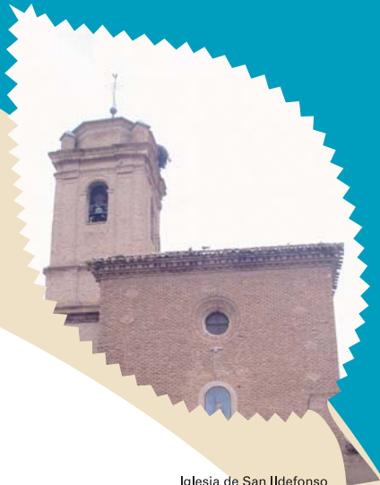
Iglesia de San Ildelfonso