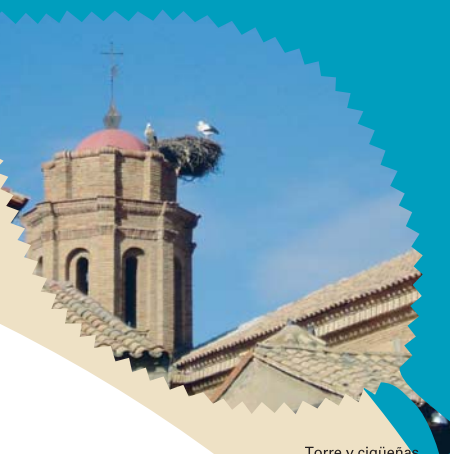
Torre y cigüeñas