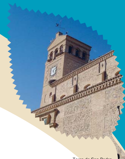
Torre de San Pedro