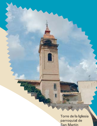
Torre de la Iglesia parroquial de San Martín