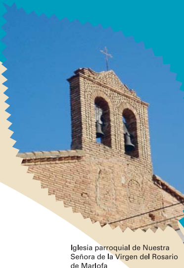
Iglesia parroquial de Nuestra Señora de la Virgen del Rosario de Marlofa