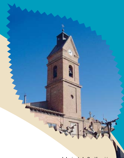
Iglesia de la Purificación