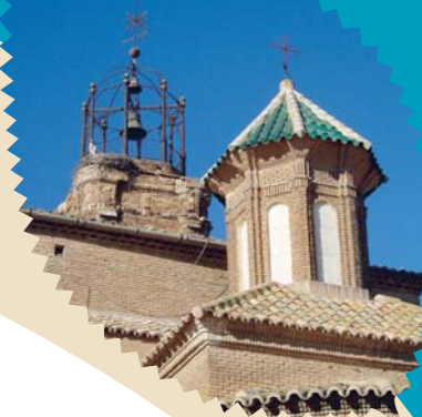
Iglesia parroquial de Nuestra Señora de los Ángeles

✦ Dirección: Arco del Marqués 10 ✦ Teléfono: 976 613 005 ✦ E-mail: info@rialebro.net ✦ Web: www.rialebro.net