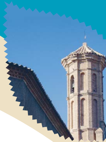
Torre de la iglesia parroquial de San Pedro Mártir