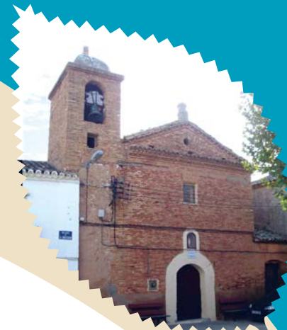
Iglesia parroquial de San Juan Bautista