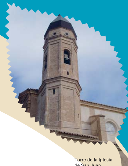
Torre de la Iglesia de San Juan