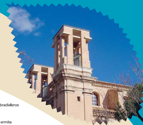
Iglesia parroquial de Santiago