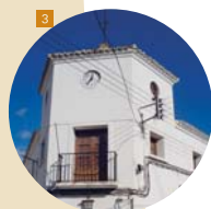
1 Escudo de Sobradriel